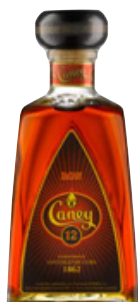
12 Años Seite 22