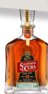
Extra Añejo 25 Años Seite 33