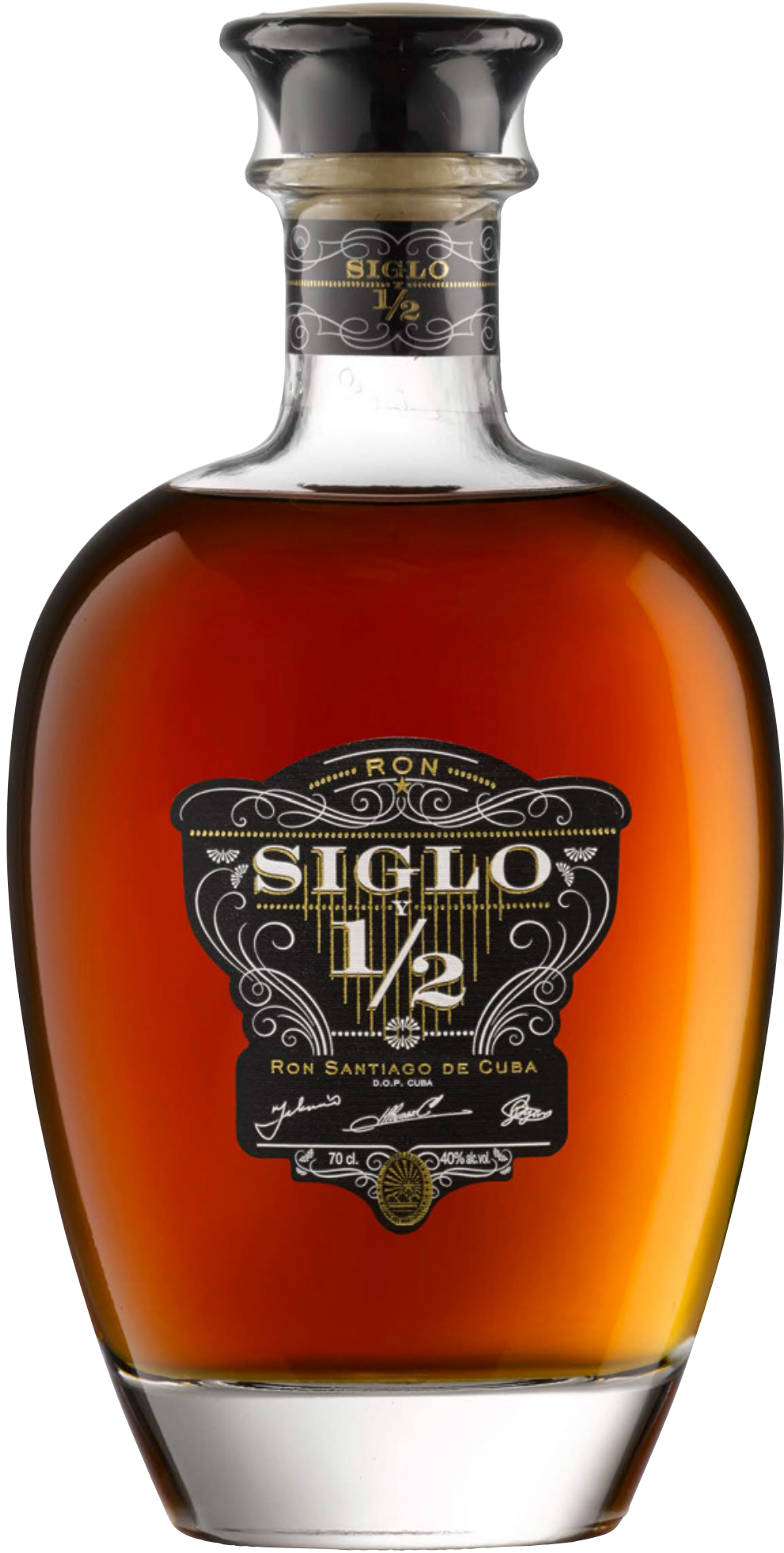
Ron Santiago de Cuba