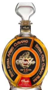
Extra Añejo 15 Años Seite 26