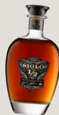
SIGLO y 1/2 Seite 34