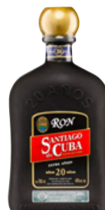
Extra Añejo 20 Años Seite 33